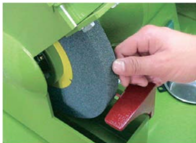
檢視砂輪有無裂痕破損